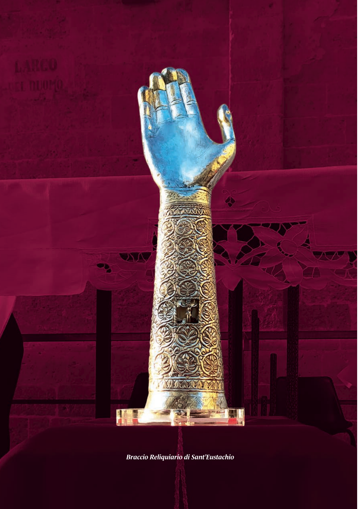
Braccio Reliquiario di Sant'Eustachio